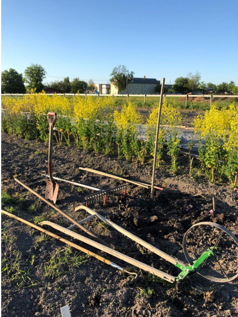
t.v Anbefalt utstyr: jernrive, merkerive, ugresskyffel/kålrothakke, spade, breigaffel, kultivator med 3 tinder, pendelhakke (andre kan jo selvsagt være aktuelle) t.h Halm som jorddekke utenom vekstsesong