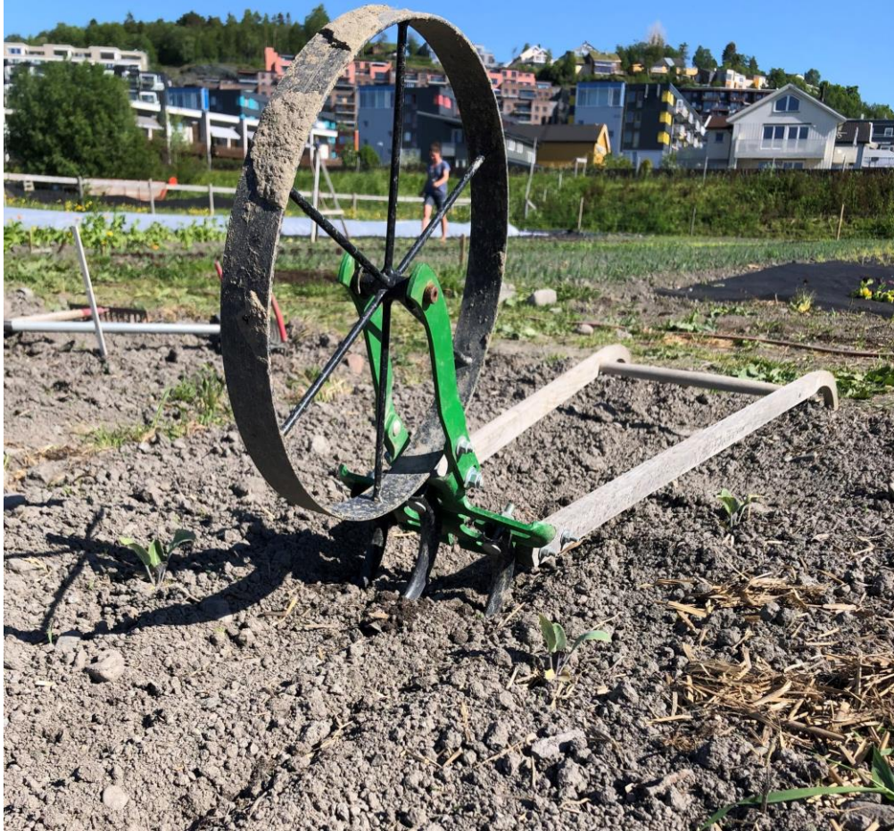
t.v. Kultivator med 3 tinder t.h. Breigaffel med 5 tinder